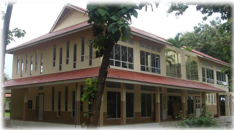
ប្លង់ស្ថាបត្យកម្មថ្មីដើម្បីលើកស្ទួយបរិស្ថានសិក្សា: អគារសិក្សាថ្មីដែលប្រើប្រាស់កញ្ចក់ ច្រើន និងសួនច្បារ បើប្រៀបធៀបជាមួយសាលាធម្មតាមគឺមិនអាចធ្វើបានទេ

ហើយក៏បានបង្ហាញឲ្យ ឃើញថាមានតម្លៃថោក ជាងអគារស្តង់ដារដែល ជិតខាងជាច្រើនសាងសង់ ដោយធានាគារអភិវឌ្ឍ អន្តរជាតិ។ ដូចនេះការប្រើ ស្ថាបត្យកម្មថ្មីប្រឌិតថ្មី បានក្លាយជាយុទ្ធសាស្ត្រ គន្លឹះក្នុងការកែលម្អរូបវន្ត សាលារៀនស្របនឹង បំណងប្រាថ្នា និងជាការ លើកទឹកចិត្តទាំងសិស្ស