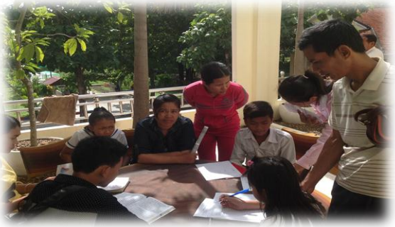
តម្រូវការឪពុកម្តាយច្រើនជាងការរំពឹងទុក មាតាបិតាសិស្ស បំពេញបែបបទចុះឈ្មោះនៅសាលាអនុវត្តដែលពិសោធន៍ អភិបាលកិច្ច និងទម្រង់នៃការបង់ថ្លៃសិក្សា។

បញ្ហាប្រឈម: បន្ទាប់ពីប្រតិបត្តិការអស់រយៈពេល៣ឆ្នាំ កន្លងមក ទស្សនៈរបស់សហគមន៍ទៅលើគុណភាពអប់រំ ដែលយ៉ាងហោចណាស់នៅក្នុងសាលារៀនពីរបស់ គម្រោង មានភាពប្រសើរឡើងគួរឲ្យកត់សម្គាល់។ ទោះជា យ៉ាងនេះក្តី និរន្តរភាពនៃគំរូនេះនៅតែជាបញ្ហាប្រឈម ដោយសារតែថវិកា PB និងSIG មិនមានគ្រប់គ្រាន់ សម្រាប់រក្សាស្តង់ដារដែលគម្រោងផ្តល់ឲ្យ ក៏វាក៏មិនមែនជា ប្រភពប្រាក់ចំណូលដែលផ្តល់ឲ្យបានទៀងទាត់ និងមាន