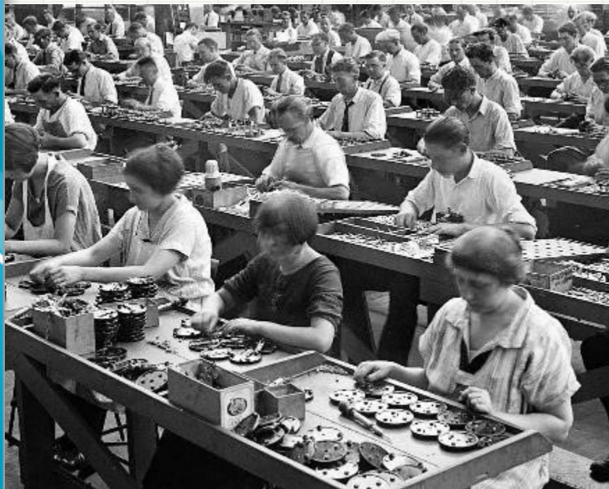
ថ្នាក់រៀនថេល័រនិយម