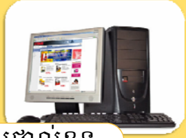
កុំព្យូទ័រផ្ទាល់ខ្លួន