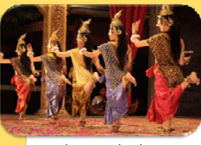
សេរីភាពដើម្បីប្រតិបត្តិវប្បធម៌របស់ខ្ញុំផ្ទាល់