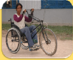
សិទ្ធិសម្រាប់ការពារពីការរើសអើង