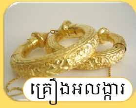
គ្រឿងអលង្ការ