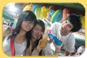
មិត្តភក្តិ