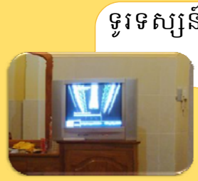
ទូរទស្សន៍