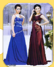
សំលៀកបំពាក់ និងម៉ូដនិយមថ្មី