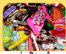
ស្ករគ្រាប់ និង នំស្រួយ