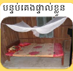
បន្ទប់គេងផ្ទាល់ខ្លួន