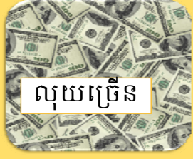
លុយច្រើន