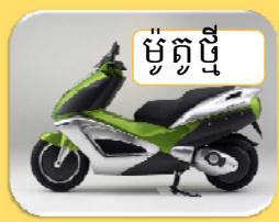
ម៉ូតូថ្មី