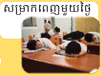
សម្រាកពេញមួយថ្ងៃ