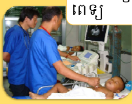
ការថែរក្សាជម្ងឺពីគ្រូពេទ្យ