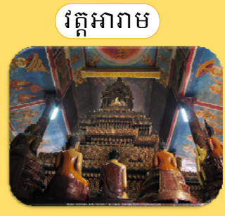
វត្តអារាម