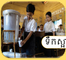
ទឹកស្អាត