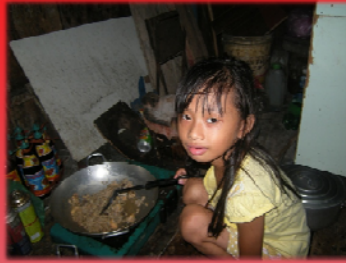
មានតែមនុស្សស្រីទេ ដែលគួររៀនចម្អិនម្ហូប