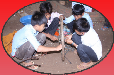
បុរសគួរចេះជុំសជុំលវត្ត មួយចំនួន