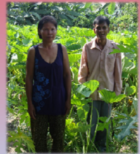
ប្រសិនបើប្រៀបធៀបវាវាង បុរសជាមួយស្ត្រី បុរស មានជីវិតងាយស្រួលជាង