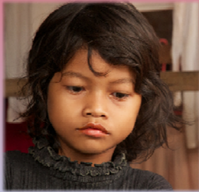
វាមិនល្អទេដែលឪពុកម្តាយបង្ហាញ ក្តីស្រឡាញ់ខ្លាំងពេកទៅកាន់កូនៗ ព្រោះវាអាចធ្វើឲ្យពួកគេទំរើស និង មានភាពក្រអឺតក្រទម