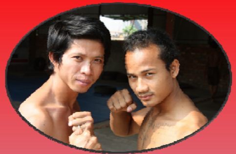
វាជាការងាររបស់ឪពុកដែល ត្រូវបង្រៀនកូនឲ្យចេះវាយ