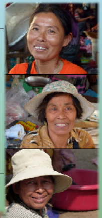
វាជាសិទ្ធិរបស់ បុរសដែលអាច មានដៃគូរួម ភេទលើសពី មួយក្នុងពេល តែមួយ