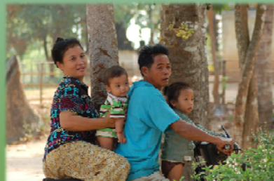
ឪពុកគួរជិតស្និទ្ធជាមួយកូន ប្រសរបស់គាត់ ម្តាយគួរជិត ស្និទ្ធជាមួយកូនស្រីរបស់គាត់