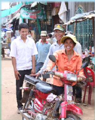
បុរសអាចបើក ម៉ូតូបានល្អ ប្រសើរជាងស្ត្រី