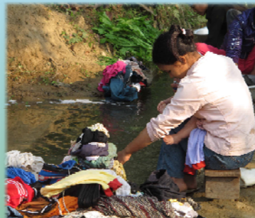
បុរសគួររៀនបោកខោអាវ របស់ខ្លួនពួកគេ