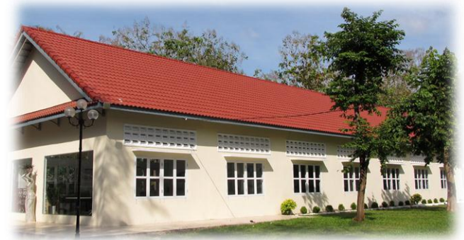
មុន និងក្រោយ កាលពីមុននិងក្រោយសាលាអនុវត្តបាន ប្រែក្លាយទៅជាសាលាជំនាន់ថ្មី

ការរៀបចំរចនាសម្ព័ន្ធអភិបាលកិច្ចថ្មី និងការជ្រើសរើសគ្រូ៖ គម្រោងបានចាប់ផ្តើមដំណើរការវិនិយោគ មិនគ្រាន់តែ ទៅលើហេដ្ឋារចនាសម្ព័ន្ធ គ្រឿងសង្ហារឹម និងបរិក្ខារសំខាន់ៗប៉ុណ្ណោះទេ ប៉ុន្តែក៏វិនិយោគទៅលើបែបបទគ្រប់គ្រង សាលារៀនផងដែរ។ ក្រុមប្រឹក្សាភិបាលដែលមានសមាភាពមកពីមន្ទីរអប់រំ យុវជន និងកីឡាខេត្ត និងមន្ត្រីអង្គការ ខេបត្រូវបានបង្កើតឡើងដើម្បីធានាឲ្យបាននូវគណនីយភាពសម្រាប់បុគ្គលិកសាលារៀនទាំងនោះក្នុងបំពេញការ