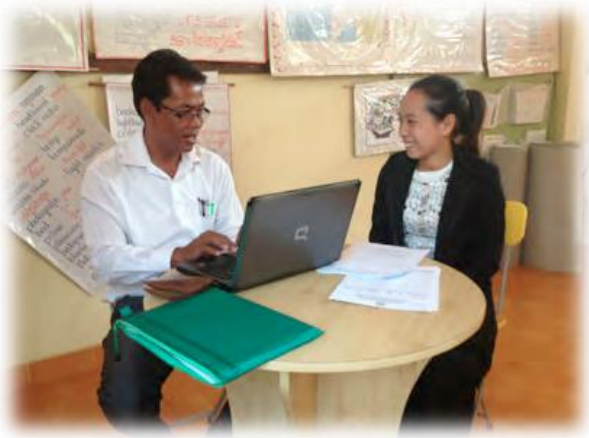
ការប្រជុំជាមួយគ្រូដើម្បីតាមដានលើផែនការ និងការឆ្លុះបញ្ចាំងពីកំណត់ត្រា

ទាក់ទងទៅនឹងអ្វីដែលរៀបរាប់ខាងលើគឺជាបញ្ហាច្រកអាជីពសម្រាប់បុគ្គលបម្រើការងាររដ្ឋដែលបានបង្ហាញនូវឥរិយាបថវិជ្ជាជីវៈល្អ។ និយាយឲ្យខ្លីមានច្រកអាជីពបែបនេះគឺតូចណាស់សម្រាប់គ្រូបង្រៀន និងនាយកសាលាឆ្នើមបំផុតក្នុងប្រព័ន្ធអប់រំសាធារណៈនៅក្នុងប្រទេសកម្ពុជា។ ដូចនេះប្រព័ន្ធជាក់លាក់មួយក្នុងការបន្តផ្តល់រង្វាន់ (ឧ. អាហារូបករណ៍សម្រាប់បន្តការសិក្សា កុំព្យូទ័រយូរដៃ និងឱកាសសម្រាប់ការអភិវឌ្ឍ) ដែលទទួលស្គាល់ពីឥរិយាបថវិជ្ជាជីវៈគឺពិតជាត្រូវការចាំបាច់ដើម្បីធានាបាននូវការបន្តលើកទឹកចិត្ត និងគុណភាពនៅតាមសាលារៀនគោលដៅ។