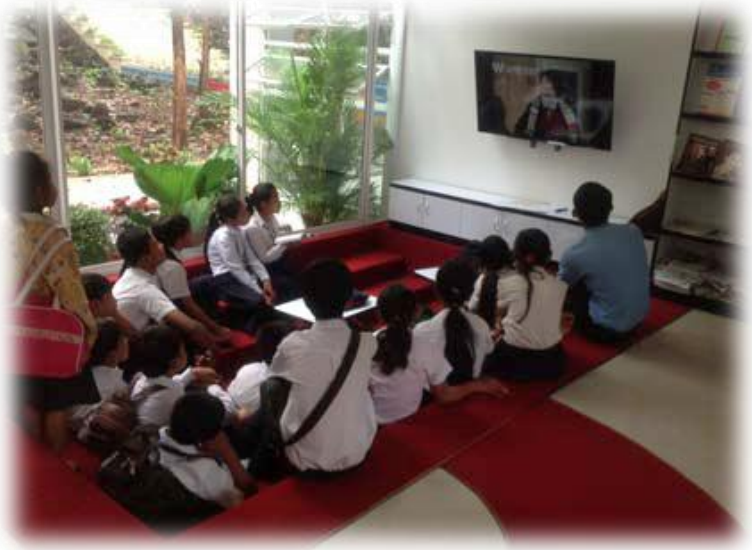
ការបង្កើតមណ្ឌលព័ត៌មាន: សិស្សបានកំពុងទស្សនាភាពយន្តឯកសារដែលជាផ្នែកមួយនៃមេរៀនប្រចាំថ្ងៃ

ទោះបីជាគ្រូបង្រៀនបានទទួលប្រាក់លើកទឹកចិត្តបន្ថែមអាស្រ័យការបំពេញកិច្ចការពិសេសបានអនុវត្ត វាសំខាន់ស្មើគ្នា ដែលគ្រូៗទើបត្រូវបានជ្រើសរើសថ្មីៗត្រូវវាយតម្លៃខ្ពស់មិនមែនតែទៅលើការលើកទឹកចិត្តផ្នែកថវិកាតែមួយមុខនោះទេ ប៉ុន្តែគាត់ត្រូវឲ្យតម្លៃទៅលើការទទួលបាននូវការពង្រឹងវិជ្ជាជីវៈគ្រូបង្រៀនទៀតផង ។