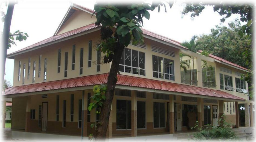
ប្លង់ស្ថាបត្យកម្មថ្មីដើម្បីលើកស្ទួយបរិស្ថានសិក្សា: អគារសិក្សាថ្មីដែលប្រើប្រាស់កញ្ចក់ ច្រើន និងសួនច្បារ បើប្រៀបធៀបជាមួយសាលាធម្មតាមគឺមិនអាចធ្វើបានទេ

ហើយក៏បានបង្ហាញឲ្យ ឃើញថាមានតម្លៃថោក ជាងអគារស្តង់ដារដែល ជិតខាងជាច្រើនសាងសង់ ដោយធានាគារអភិវឌ្ឍ អន្តរជាតិ។ ដូចនេះការប្រើ ស្ថាបត្យកម្មថ្មីប្រឌិតថ្មី បានក្លាយជាយុទ្ធសាស្ត្រ គន្លឹះក្នុងការកែលម្អរូបវន្ត សាលារៀនស្របនឹង បំណងប្រាថ្នា និងជាការ លើកទឹកចិត្តទាំងសិស្ស