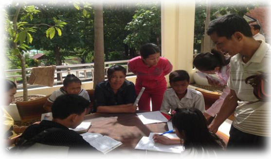
តម្រូវការឪពុកម្តាយច្រើនជាងការរំពឹងទុក មាតាបិតាសិស្ស បំពេញបែបបទចុះឈ្មោះនៅសាលាអនុវត្តដែលពិសោធន៍ អភិបាលកិច្ច និងទម្រង់នៃការបង់ថ្លៃសិក្សា។

បញ្ហាប្រឈម: បន្ទាប់ពីប្រតិបត្តិការអស់រយៈពេល៣ឆ្នាំ កន្លងមក ទស្សនៈរបស់សហគមន៍ទៅលើគុណភាពអប់រំ ដែលយ៉ាងហោចណាស់នៅក្នុងសាលារៀនពីរបស់ គម្រោង មានភាពប្រសើរឡើងគួរឲ្យកត់សម្គាល់។ ទោះជា យ៉ាងនេះក្តី និរន្តរភាពនៃគំរូនេះនៅតែជាបញ្ហាប្រឈម ដោយសារតែថវិកា PB និងSIG មិនមានគ្រប់គ្រាន់ សម្រាប់រក្សាស្តង់ដារដែលគម្រោងផ្តល់ឲ្យ ក៏វាក៏មិនមែនជា ប្រភពប្រាក់ចំណូលដែលផ្តល់ឲ្យបានទៀងទាត់ និងមាន