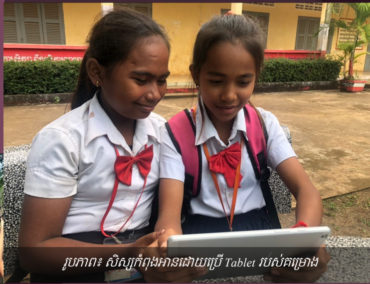
រូបភាព៖ សិស្សកំពុងអានដោយប្រើ Tablet របស់គម្រោង