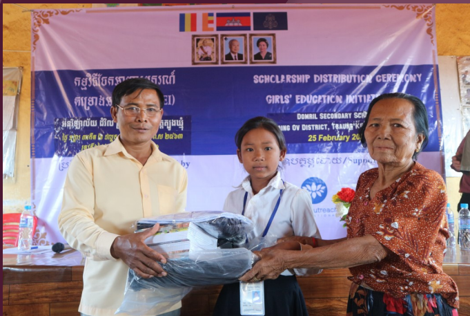
រូបភាព៖ កុមារីទទួលបានកញ្ចប់អាហារូបករណ៍ពីគម្រោង