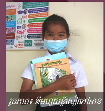
រូបភាព៖ គឺមហួយខ្ចីសៀវភៅអាន