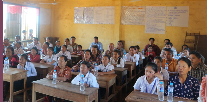
រូបភាព៖ សកម្មភាពការចូលរួមពីការិយាល័យ លោកនាយក លោកគ្រូអ្នកគ្រូ និង អាណាព្យាបាលសិស្ស