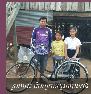
រូបភាព៖ គឺមហួយទទួលបានកង