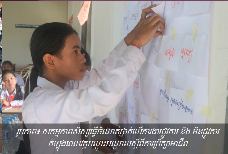
រូបភាព៖ សកម្មភាពសិស្សធ្វើចំណាត់ថ្នាក់លើការងារផ្លូវការ និង មិនផ្លូវការ កំឡុងពេលវគ្គបណ្តុះបណ្តាលស្តីពីការប្រឹក្សាអាជីព