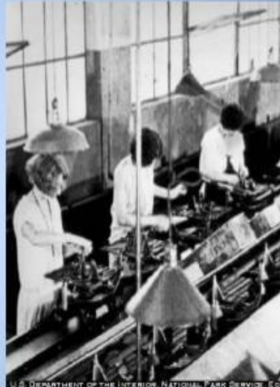
U.S. DEPARTMENT OF THE INTERIOR, NATIONAL PARK SERVICE, E.C.