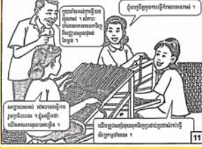
ប្រើប្រាស់ប្រព័ន្ធសេដ្ឋកិច្ច ដើម្បីបង្កើនចំណូលសំរាប់ខ្លួនខ្ញុំ។