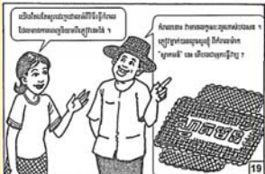
ប្រើប្រាស់ប្រព័ន្ធសេដ្ឋកិច្ច ដើម្បីបង្កើនចំណូលសំរាប់ខ្លួនខ្ញុំ។