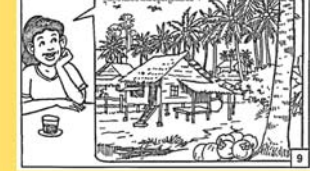
ប្រើប្រាស់ប្រព័ន្ធសេដ្ឋកិច្ច ដើម្បីបង្កើនចំណូលសំរាប់ខ្លួនខ្ញុំ។