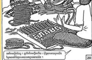
ប្រើប្រាស់ប្រព័ន្ធសេដ្ឋកិច្ច ដើម្បីបង្កើនចំណូលសំរាប់ខ្លួនខ្ញុំ។