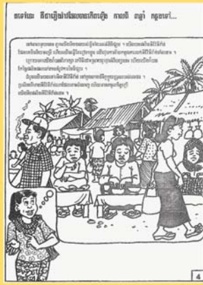
ប្រើប្រាស់លទ្ធភាពនៃប្រព័ន្ធសេដ្ឋកិច្ច ដើម្បីបង្កើនចំណូលសំរាប់ខ្លួនខ្ញុំ។