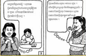
ដាក់ទុនមួយចំណែកទៅក្នុងក្រុមហ៊ុន ដើម្បីបង្កើនចំណូលសំរាប់ខ្លួនខ្ញុំ។