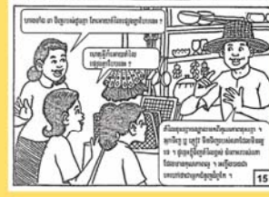
ប្រើប្រាស់ប្រព័ន្ធសេដ្ឋកិច្ច ដើម្បីបង្កើនចំណូលសំរាប់ខ្លួនខ្ញុំ។