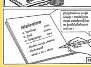
ប្រើប្រាស់ប្រព័ន្ធសេដ្ឋកិច្ច ដើម្បីបង្កើនចំណូលសំរាប់ខ្លួនខ្ញុំ។