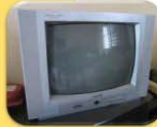
ទូរទស្សន៍