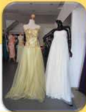
សំលៀកបំពាក់ និង ម៉ូដនិយមថ្មី