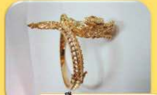
គ្រឿងអលង្ការ