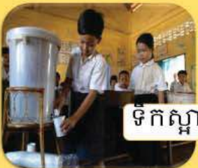
ទឹកស្អាត