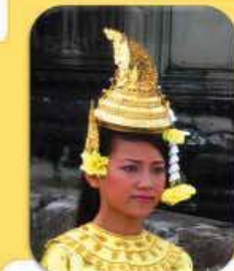
សេរីភាពដើម្បីប្រតិបត្តិវប្បធម៌របស់ខ្លួនផ្ទាល់