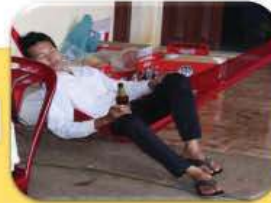
សម្រាកពេញមួយថ្ងៃ