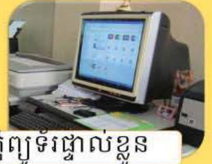
កុំព្យូទ័រផ្ទាល់ខ្លួន