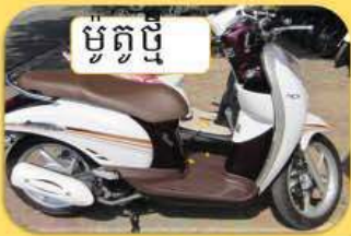
ម៉ូតូថ្មី