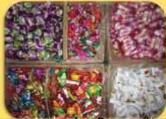
ស្ករគ្រាប់ និង នំស្រួយ