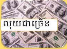
លុយជាច្រើន