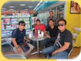
មិត្តភក្តិ