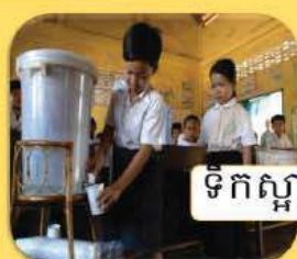
ទឹកស្អាត