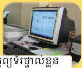
កុំព្យូទ័រផ្ទាល់ខ្លួន