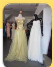
សំលៀកបំពាក់ និង ម៉ូដនិយមថ្មី