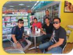
មិត្តភក្តិ