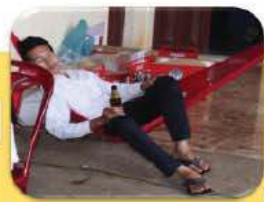
សម្រាកពេញមួយថ្ងៃ