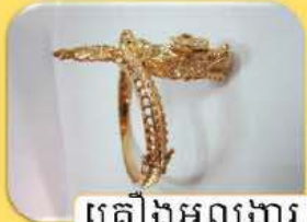
គ្រឿងអលង្ការ