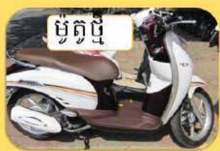
ម៉ូតូថ្មី