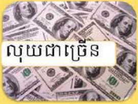
លុយជាច្រើន