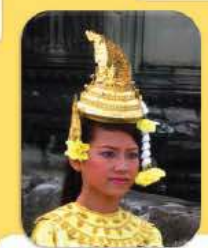
សេរីភាពដើម្បីប្រតិបត្តិវប្បធម៌របស់ខ្ញុំផ្ទាល់