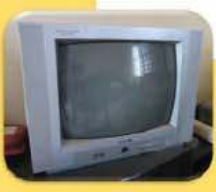
ទូរទស្សន៍