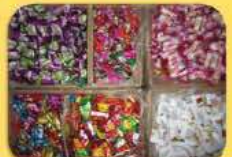
ស្ករគ្រាប់ និង នំស្រួយ